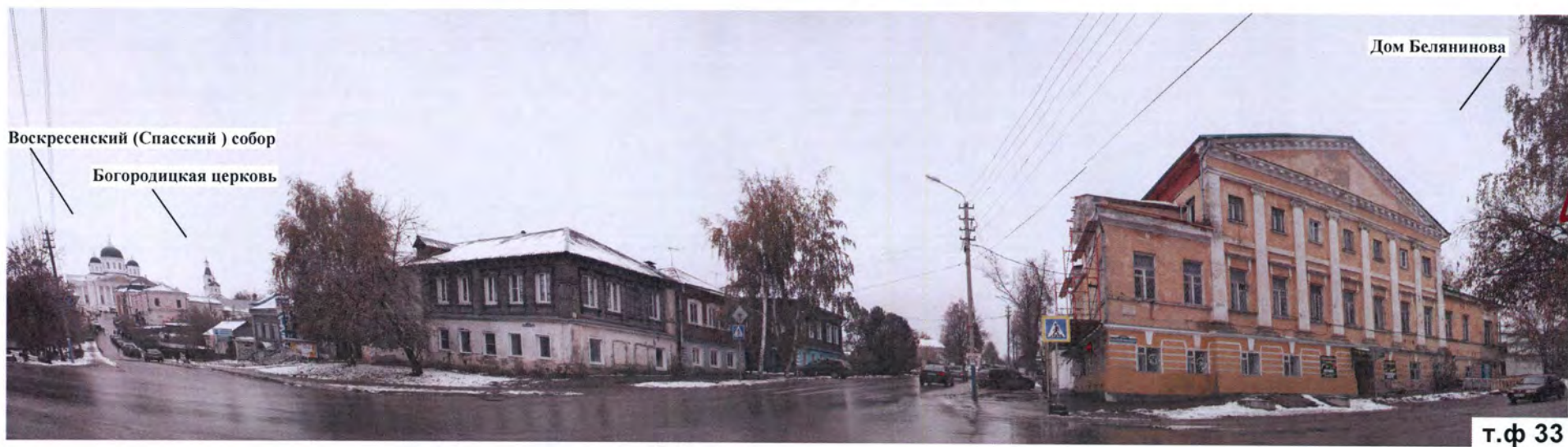
Воскресенский (Спасский) собор