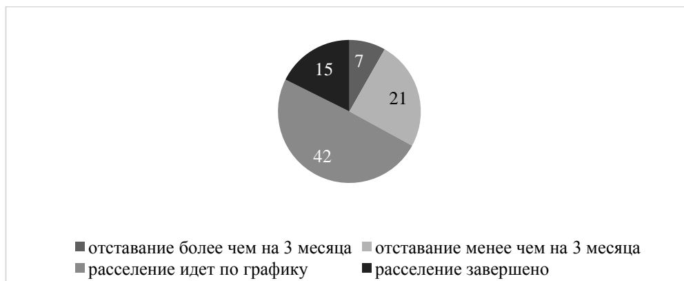
Рис. 3 – Исполнение субъектами Российской Федерации региональных адресных программ по переселению граждан из аварийного жилищного фонда на 01.11.2017. (Источник: официальный сайт «Реформа ЖКХ»).

В красной зоне находятся такие субъекты как Забайкальский край, республики Крым, Карелия, Тыва, Татарстан, Чувашская республика и Тверская область.