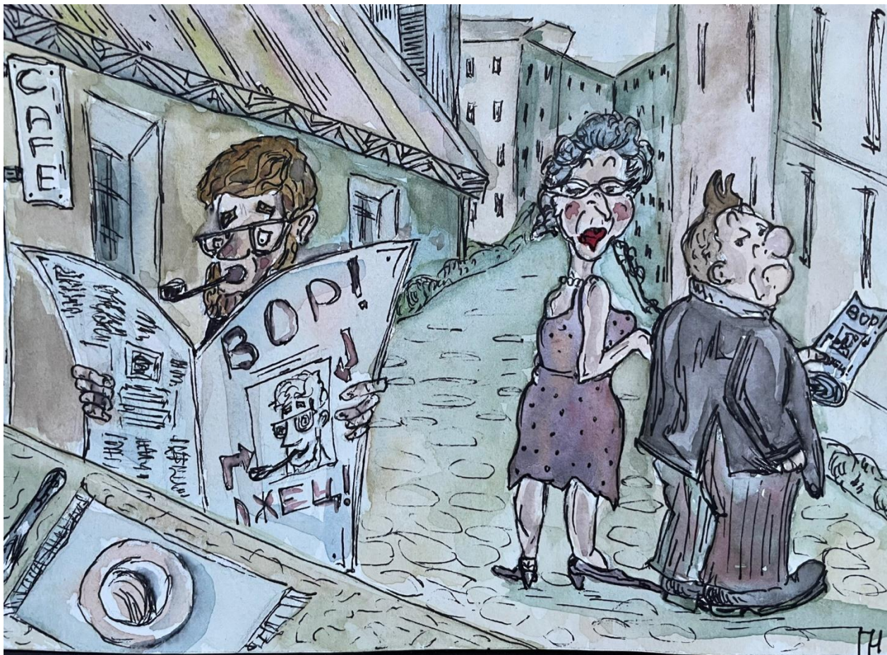
Иллюстрация показывает гражданские неимущественные права, в которые входят защита чести, достоинства и деловой репутации. Чиновник Воришкин, обедая в своём любимом кафе, взял в руки лежащую рядом с ним газету, и увиденный заголовок шокировал его. Воришкина, самого честного чиновника в городе, назвали вором и лжецом.

Получается, что о нем были написаны сведения, которые содержали утверждения о нарушении гражданином действующего законодательства, совершении нечестного поступка 20 .